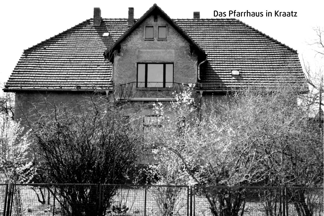
Das Pfarrhaus in Kraatz

Pfarrsprengel Gutengermendorf Ausgabe 17 Juni – Juli – August 2013