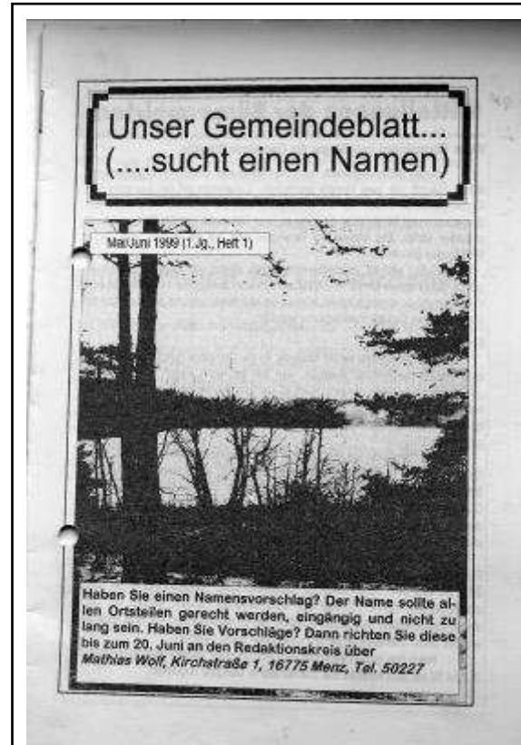
(Abbildung: Unser Heft Nr. 1 vom Mai - Juni 1999)