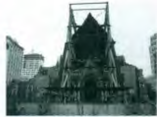
Christchurch, Kathedrale Januar 2015