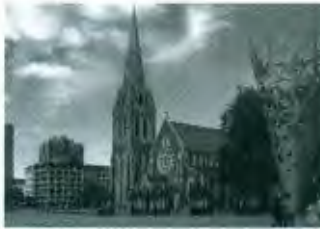
Christchurch, Kathedrale vor dem 22.02.2011