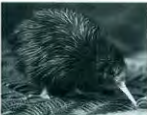
Kiwi - Nationalsymbol Neuseelands