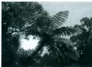
Silberfarn - Nationalsymbol Neuseelands