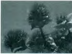
Pohutukawa, der neuseeländische Weihnachtsbaum

Bitte verabreden Sie Fahrgemeinschaften oder rufen Sie im Pfarramt Mildenberg an!