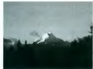
Mount Cook, 3754 m - der höchste Berg Neuseelands

Lassen Sie sich einladen auf eine Reise durch das Land, in dem man die „Welt im Kleinen“ erleben kann - mit schneebedeckten Bergen, Gletschern, die bis zu den Palmen reichen, Geysiren, Regenwäldern ... und einer faszinierenden Tier- und Pflanzenwelt.