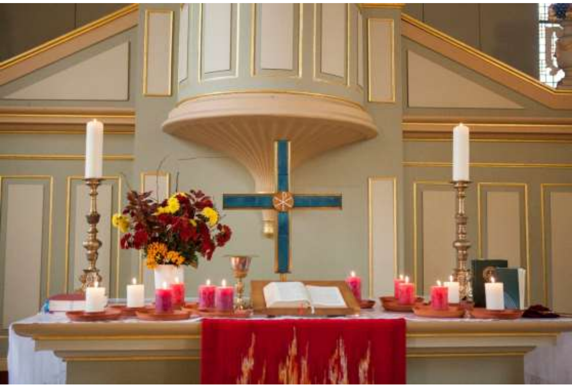
Unten: Der von den Ältesten geschmückte Altar beim Gottesdienst zur Neubildung des Pfarrsprengels Löwenberger Land am Reformationstag