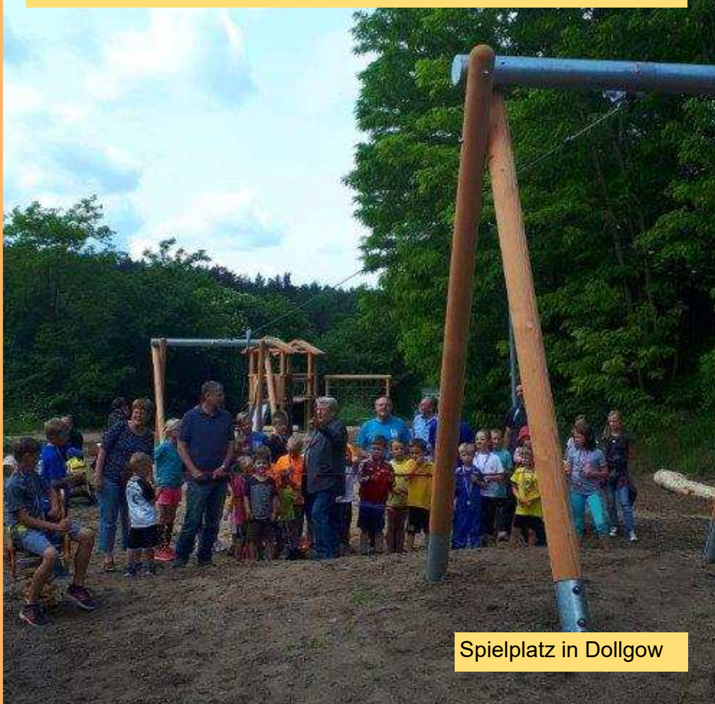
Spielplatz in Dollgow