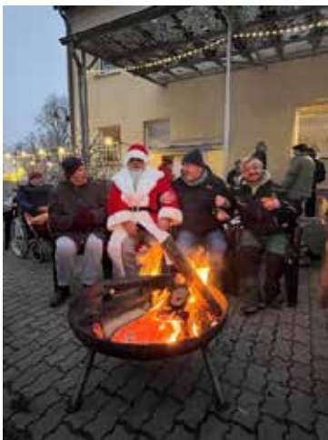
Weihnachtsmarkt am 17.12.2022

Die älteren Bewohner, die schon das Rentenalter erreicht haben und Bewohner, die nicht werkstattfähig sind,