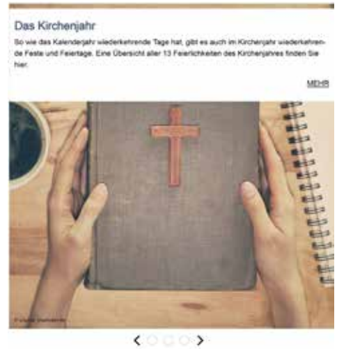
Aktuelles aus der Kirchengemeinde Marwitz Vellen

Ins neue Jahr sind wir auch mit einer eigenen Website gestartet. Diese finden sie unter www.evkirchemarwitzvelten.de .